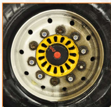
Resultat efter 3 minutter