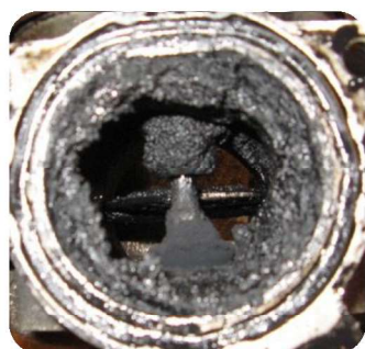
EGR før rengøring

Download: www.pld.dk under Aerosoler: 492 Intake Cleaner