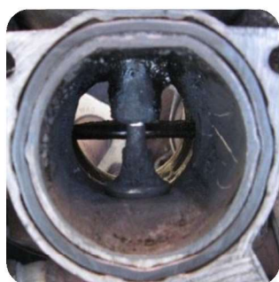
EGR efter rengøring